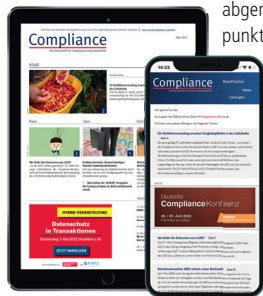
Online-Zeitschrift und Newsletter

„Compliance“ ist die zentrale Informations- und Kommunikationsplattform für Compliance-Verantwortliche im deutschsprachigen Raum. Die Online-Zeitschrift wird an rund 8.400 Abonnenten per E-Mail-Newsletter versendet und kann auch direkt über compliance-plattform.de abgerufen werden. Vier Mal jährlich führt die Zeitschrift den Schwerpunkt „Finance“ – in diesen Schwerpunktausgaben tragen wir vor allem den spezifischen Compliance-Anforderungen an die Finanzbranche Rechnung. Zentrale Inhalte sind Auf- und Ausbau einer Compliance-Struktur, Best-Practice-Beispiele aus Compliance-Abteilungen, Informationen über rechtliche Neuerungen, Karriere- und Entwicklungschancen, Portraits interessanter Persönlichkeiten aus dem Bereich GRC, Risikomanagement und IT-Lösungen, nationale und internationale Compliance-Nachrichten sowie Berichte über neue Studien.